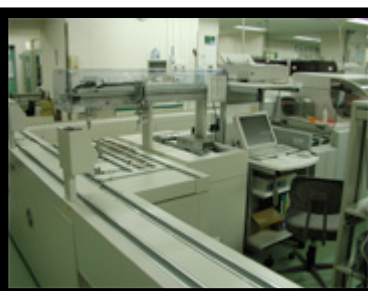
生化学分析装置・自動搬送システム