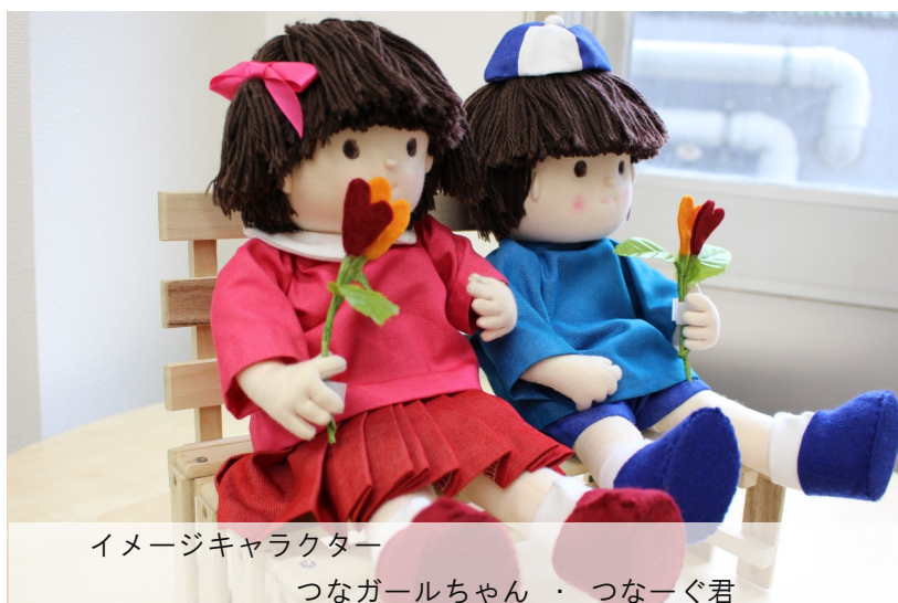
イメージキャラクター つなガールちゃん ・ つな一ぐ君